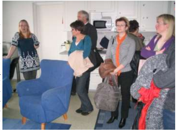
Ohjausryhmän jäseniä tutustumassa Autismisäätiön Kotkansaaren Ryhmäkotiin

Neurologisesti sairaiden ja vammaisten asuminen liittyvien palvelutarpeiden kartoittamiseksi tehdään parhaillaan selvitystyötä yhteistyössä Asumispalvelusäätiö ASPA:n kanssa. Selvityksessä kartoitetaan sekä asiakkaiden että eri toimijoiden näkemyksiä. Tuloksista kootaan toimenpidesuosituksen, joita kunnat ja tulevat yhteistoiminta-alueet voivat hyödyntää yksilöllisten ja oikein kohdennettujen asumispalvelujen kehittämisessä. Raportti julkaistaan elokuussa 2008. Osana asumispalveluiden kehittämistä kehittämissyksikön ohjausryhmä tutustui Kotkassa Autismisäätiön ja ASPA-säätiön asumisyksiköihin.