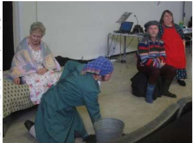
Yksi vanhustyön ajankohtaispäivien (4.-5.3.2008) helmistä, senioriteatteri MamMatit.