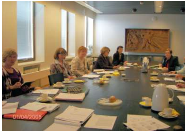
Etelä-Kymenlaakson kuntien työryhmä Kotkan kaupungintalolla 1.4.2008.

Kaakkois-Suomen lastensuojelun kehittämissuunnitelmaan sisältyvä seudullisten lastensuojelun suunnitelmien laatiminen on käynnistynyt alkuvuoden aikana Kaakkois-Suomen alueella. Kehittämissuunnittelijat lähettivät vuoden vaihteessa kuntien kunnanhallituksille kirjeet, joissa pyydettiin nimeämään jäsenet suunnitelmaa valmisteleviin työryhmiin. Jäsenten nimeämisten jälkeen työryhmät kutsuttiin ensimmäiseen ns. käynnistämiskokoukseen. Työryhmät ovat ottaneet valmistelun haltuunsa ja kehittämissuunnittelijat osallistuvat asiantuntijoina suunnitelmien laatimisprosessiin. Lastensuojelulain edellyttämien moniammatillisten asiantuntijaryhmien muodostaminen ja nimeäminen sisältyy em. suunnitelmia valmistelevien työryhmien tehtäviin.