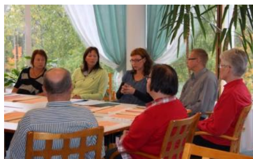
Perhehoitajien tapaaminen Luumäellä 13.9.

toimintakyvyn tukemisessa. Vanhustyön tueksi -sivusto löytyy osoitteesta: www.socom.fi —> vanhus –ja vammaistyö —> vanhustyön kehittämiskeskus —> vanhustyön tueksi .